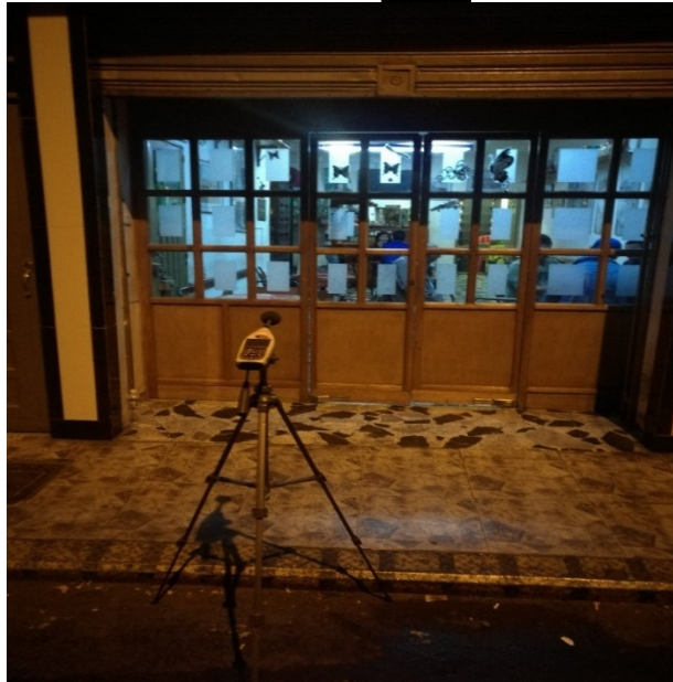
Fotografía No. 4 Punto de monitoreo